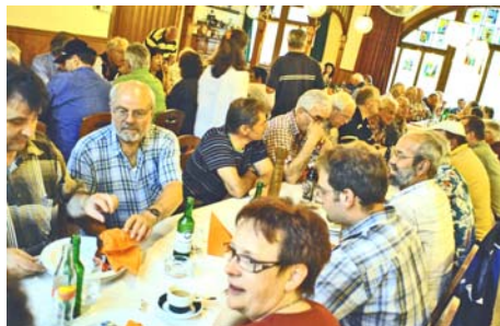
Gemütliches Zusammensitzen gehört beim Freundschaftsschiessen immer dazu