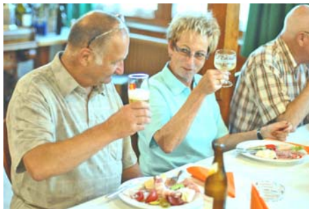
Proscht – bis zum nächste Jahr