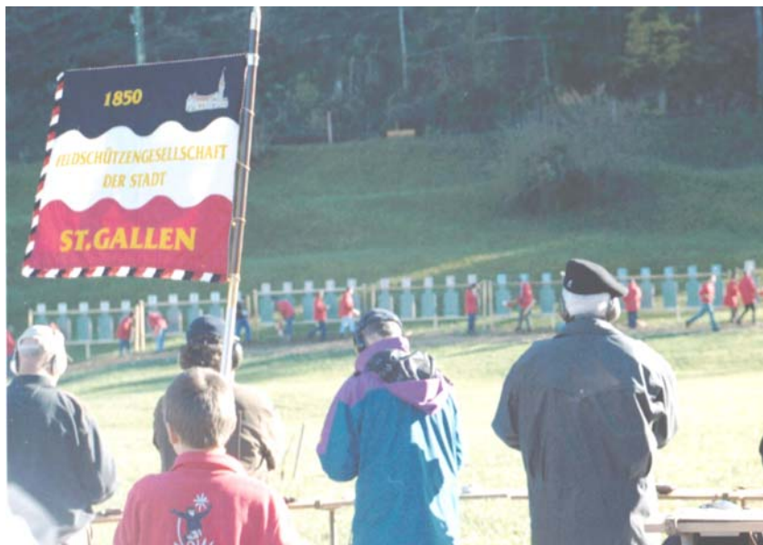
Feldschützen in der Feuerlinie am Morgarten